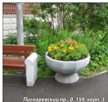
Пискаревский пр., д. 159, корп. 3