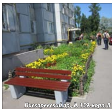
Пискаревский пр., д. 159, корп. 8