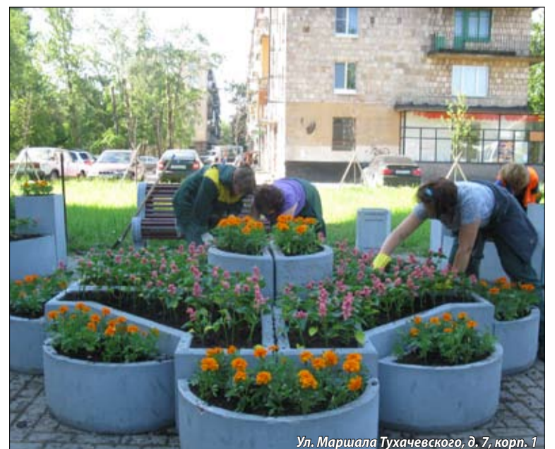
Ул. Маршала Тухачевского, д. 7, корп. 1