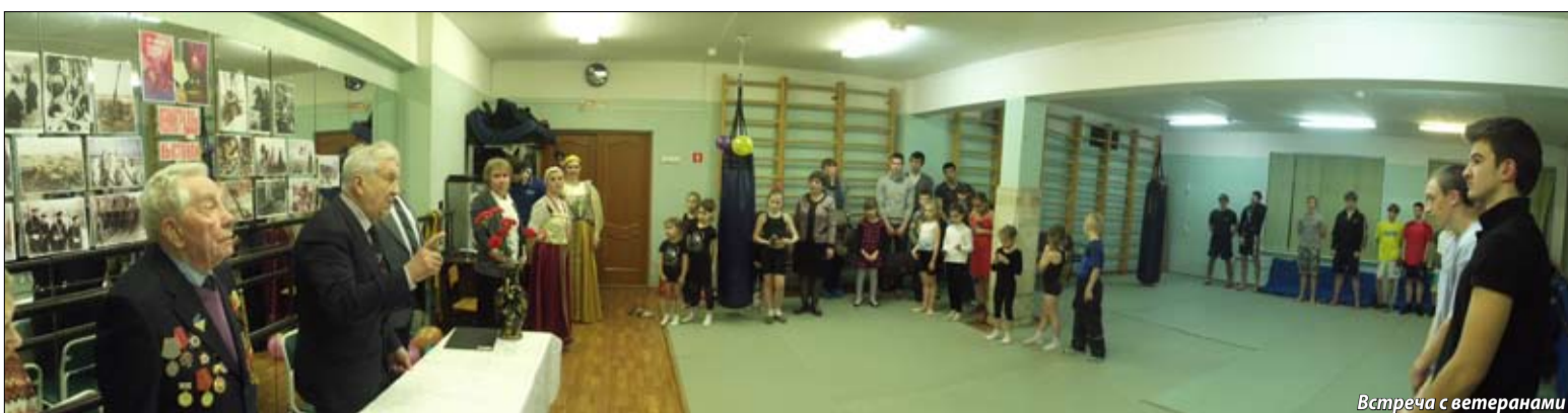
Встреча с ветеранами