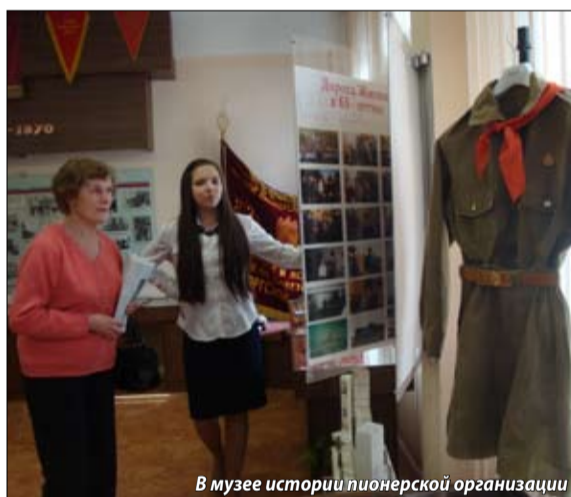
В музее истории пионерской организации