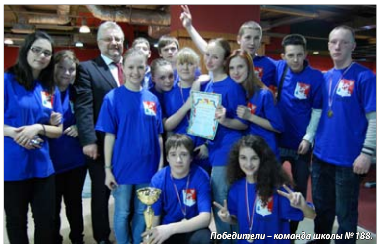
Победители – команда школы № 188.

После подведения итогов и подсчета очков за все конкурсы, победители получают заслуженные трофеи.