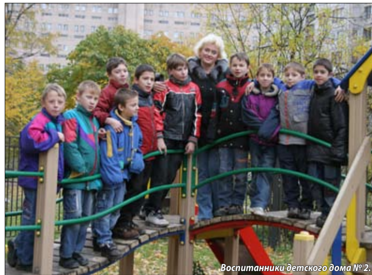
Воспитанники детского дома № 2.

Татьяна ПРОСОЧКИНА