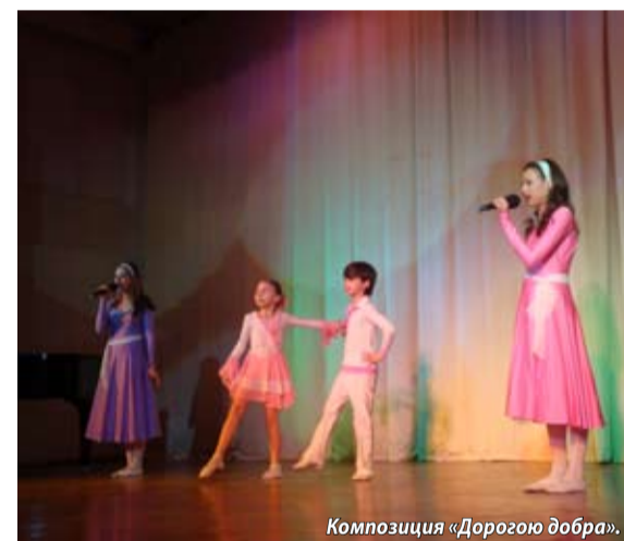
Композиция «Дорогой добра».