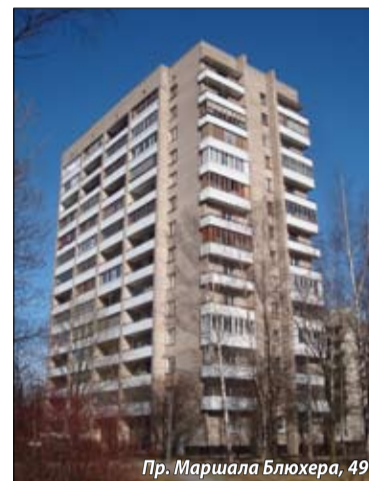
Пр. Маршала Блюхера, 49